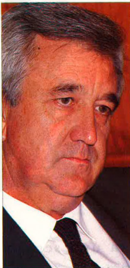
Gabriel Canellas, president del Govern Balear.

Si ens fixam en la distribució per sectors productius de la població activa, veurem com Navarra té uns índexs molt més equilibrats que Balears. Les Illes ocupen més del 60% dels seus treballadors en el sector de serveis. Navarra no arriba ni al 50%. En el sector de la construcció treballa, a Balears, un 22% de la població activa, mentre que a Navarra aquest índex baixa fins un poc més del 7%. Pel que fa a la indústria, Navarra duplica àmpliament (més del 28% dels treballadors ocupats en aquest sector) a Balears (un poc més del 12%). Idèntica si-