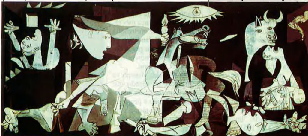
Guernika de Picasso.

aquests artistes realitzaren al llarg de la guerra civil. És el cas de les màscares de La Montserrat i Dona davant el mirall , de Juli González, els estudis del Gernika , la sèrie Barcelona de Miró o les peces que Calder va realitzar a Barcelona durant la guerra. L'Ajuntament va desestimar