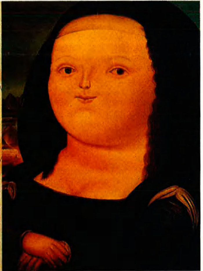
Proporció leonardesca o formes arrodonides de Botero: dues visions antagòniques de l'ésser.