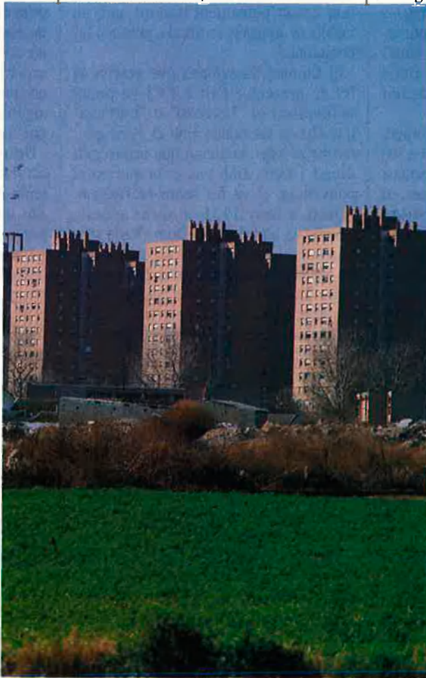
Barri perifèric a València.

En algunes de les zones els immigrants des de Catalunya o País Valencià tenen una certa im-