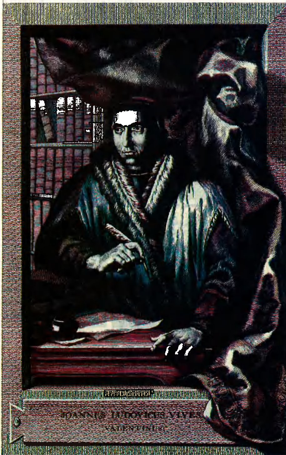
Retrat de Joan Lluís Vives, reproduït de la Nadala de la biblioteca Bas Carbonell (Xàvia, 1991).