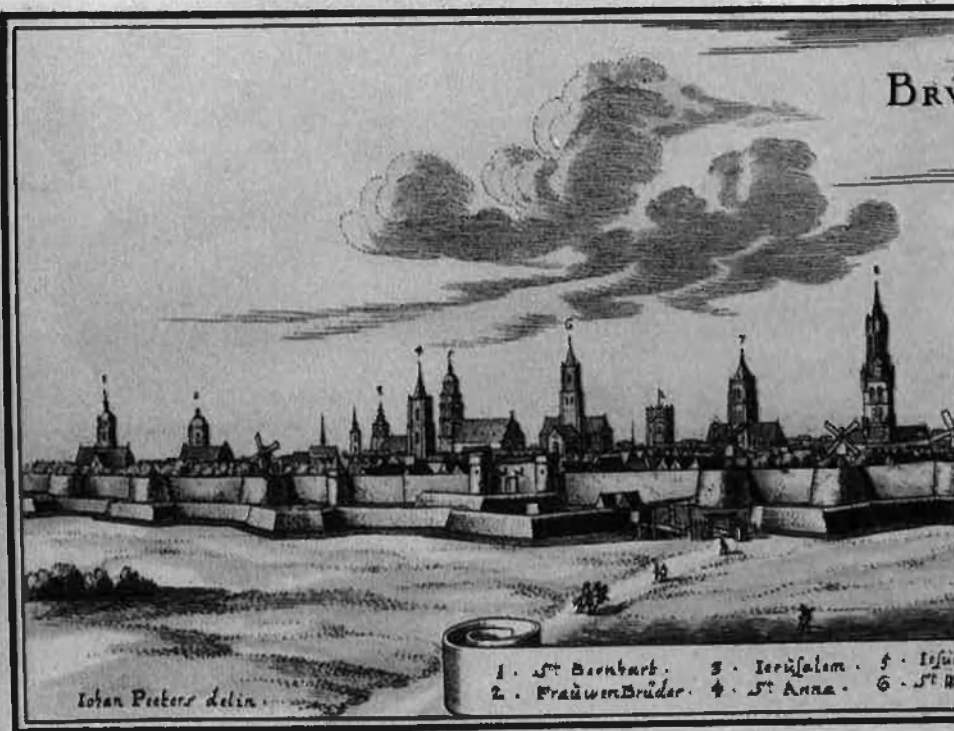
Brujes en un gravat del 1600.

Com podíem esperar d'un home del seu temps, ho féu trametent cartes als personatges que podien fer alguna cosa per tal de remeiar la situació. Com ara el neerlandès Adrià VI, a qui en el moment de ser coronat papa escriví exhortant-lo al compliment rigorós dels seus deures. O el rei anglès Enric VIII, a qui li recordava els estralls immediats de la guerra com també