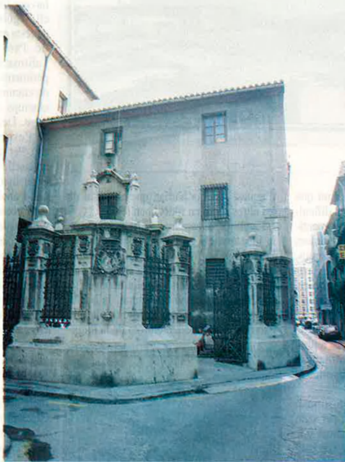
Plaça de la Creu Nova.

En els seus esforços pedagògics, l'instrument més eficaç per a ell era el llençatge, que considerava el vincle principal i l'aglutinant primordial de la societat humana. Molts dels preceptes que hi propugnava, els explanava clarament en el seu Art de parlar , Les disciplines , o la Pedagogia pueril , obres totes en què fou precursor de Locke i de molts pedagogs anglesos, començant per Mulcaster.