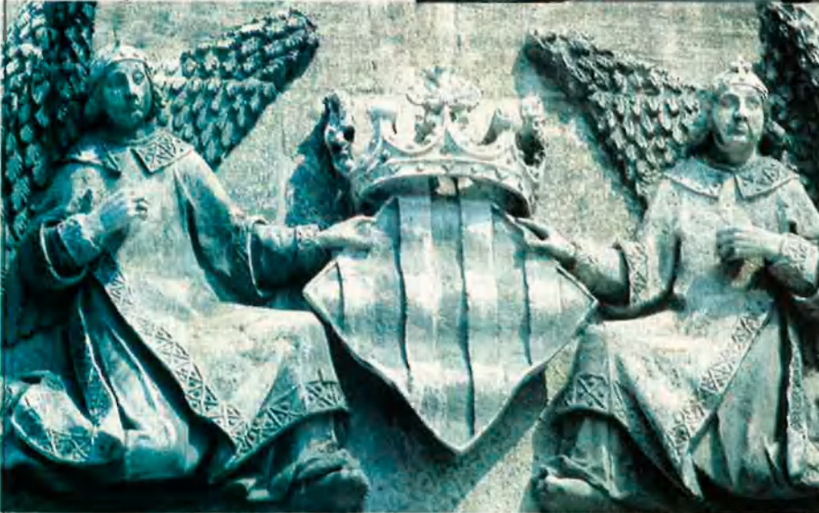
Tres aspectes de la València de Vives: la Llotja, la casa dels Valldaura, i detall de la façana de la Llotja.