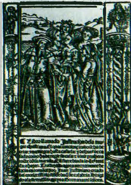
Frontispici del llibre Instrucció de la dona cristiana (1534).

I amb tot, encara avui hi ha qui defensa la idea que els contemporanis d'aquelles injustícies ho trobaven tot ben normal i mai no protestaren contra la situació. Allò que el filòsof valencià volia aconseguir significava un canvi estructural. Ja ho sabia prou. Però contra la força dels que exercien aquell poder, enfront de la inqui-