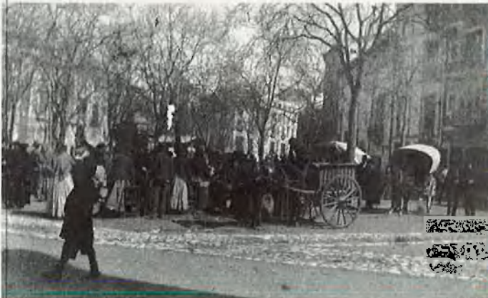
Plaça del Mercat, actualment plaça de Santa Caterina de Thomàs.