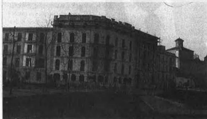
Passeig del Born.