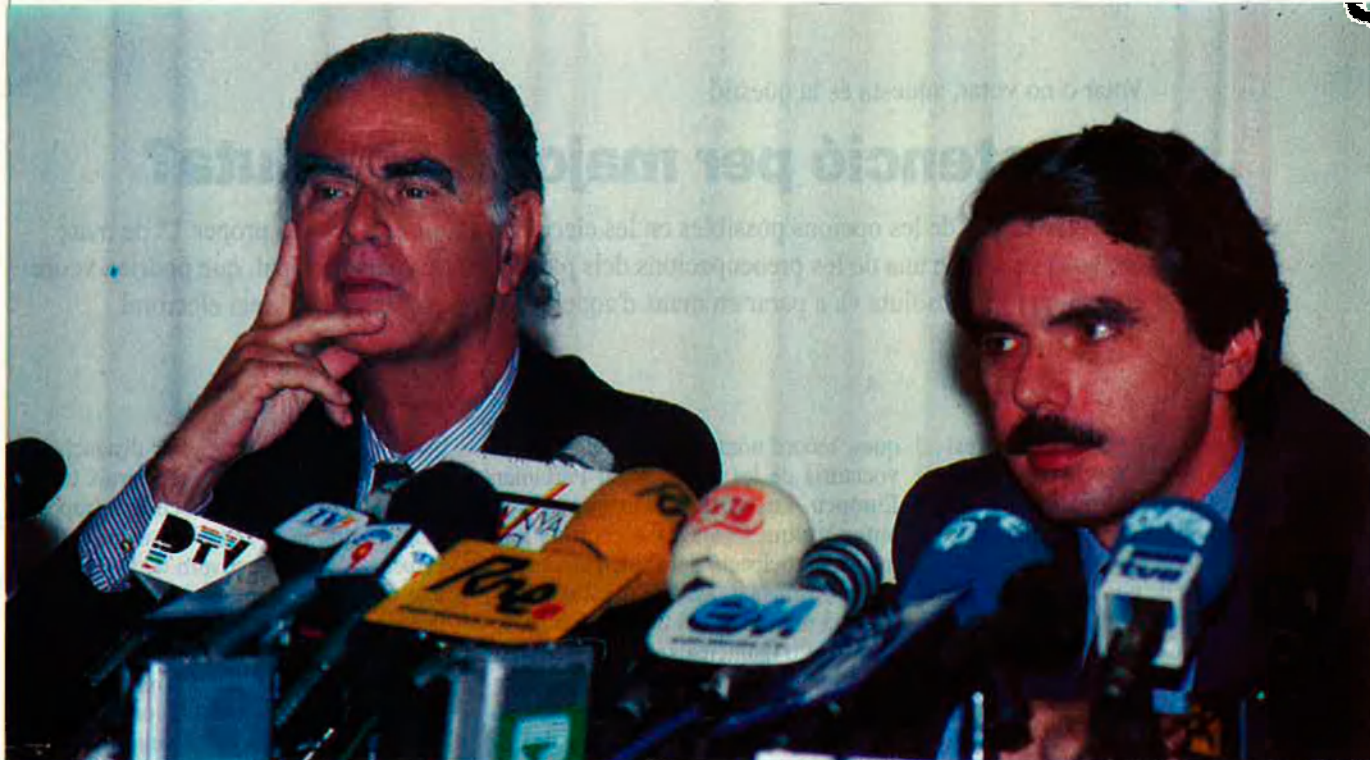
Aznar havia confiat en Broseta per a la candidatura a la presidència de la Generalitat valenciana.