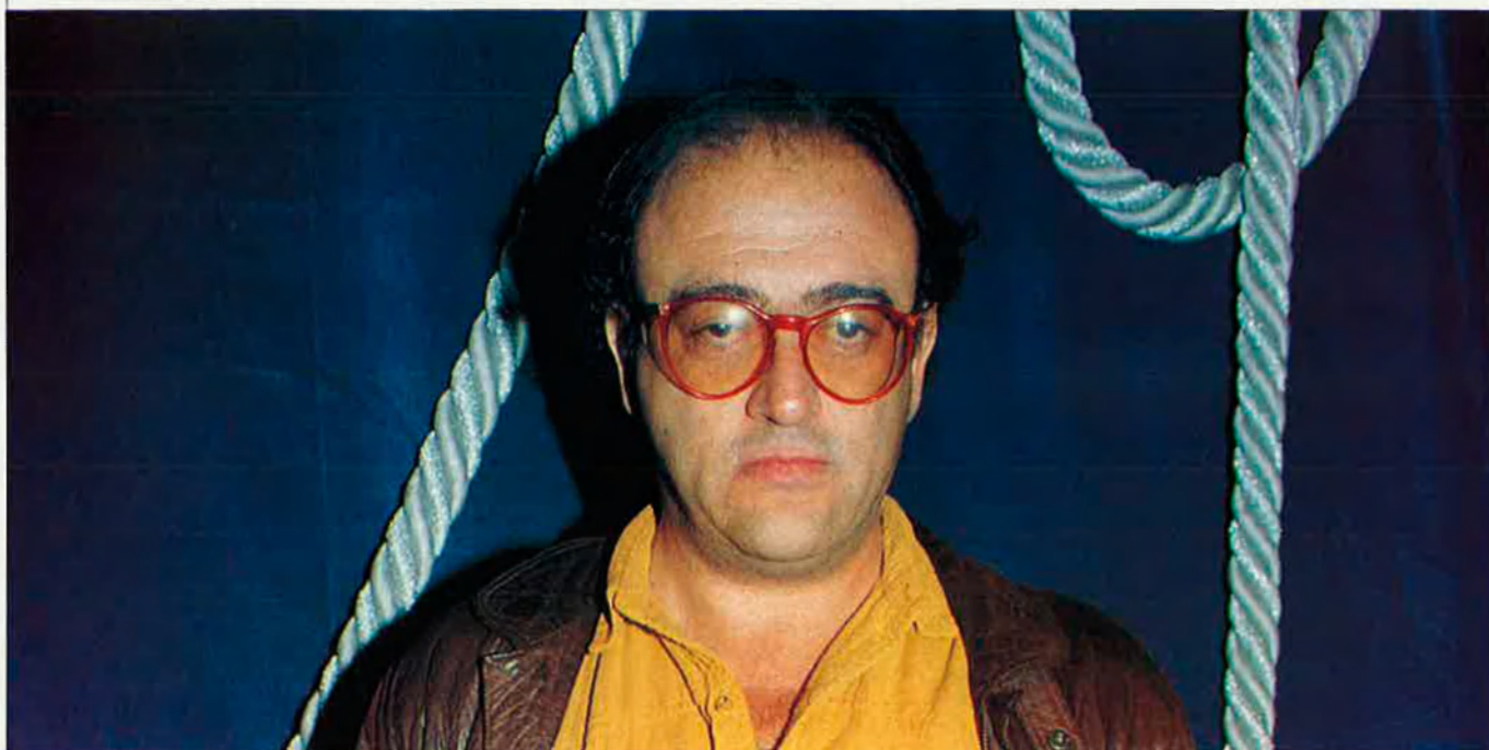
"Presumeixo de no ser artista."