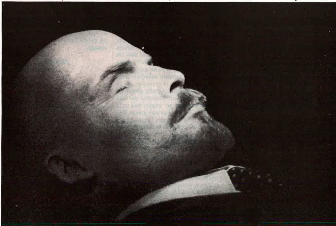
Es possible que d'ací poc de temps ja no es pugui contemplar la mòmia de Lenin.