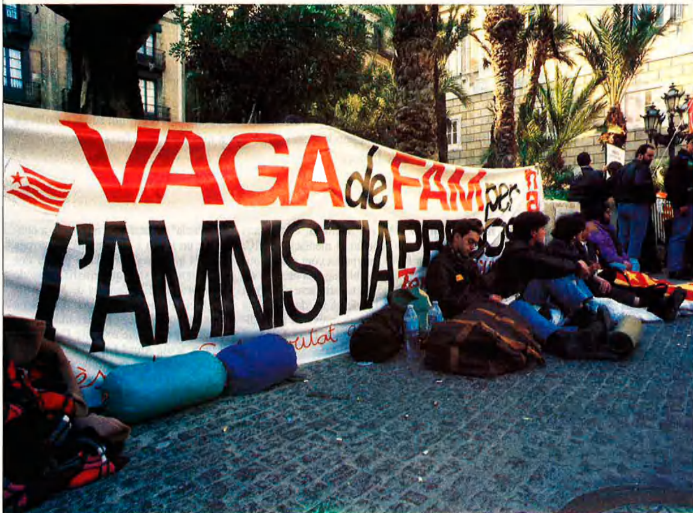
Vaga fam Terra Lliure.