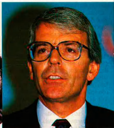
Ieltsin, Menem i Major.

S erà el 1992 un any tranquil o continuarà la saga d'anys sorpresa que hem viscut des del 1985? Ningú pot saber-ho perquè la sorpresa es basa en la imprevisibilitat. Però n'hi ha ja alguns fets anunciats, un calendari mínim.