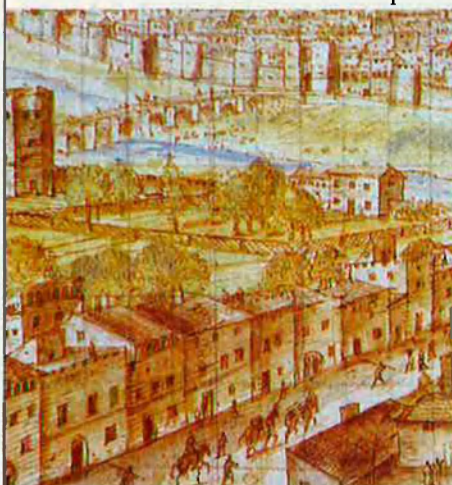
Carrer de Morvedre i entrada a València. Un dels fragments més valuosos del dibuix de Wijngaerde per la seua riquesa etnogràfica: era l'entrada del camí de Barcelona.

El conjunt iconogràfic de Wijngaerde pel que fa a la ciutat de València és d'una gran vàlua i ha permès de reconstruir el procés d'execució de la vista septentrional definitiva, dibuixada a la ploma i acolorida a l'aiguada que encapçala el repertori de la Biblioteca Nacional Austríaca (número 1; 42,5 x 141,2 cm). Els esborrany, la majoria de grans dimensions, són sis i deixen entendre quina era la tasca de camp —o carrer— i quina la que després efectuava el pintor al gabinet. Detalls com el Jardí de Cabanelles, edificis concrets com el convent del Carme o el plantejament dels ponts i clos de murada acrediten prou l'honoradesa artística de l'autor. És impres-