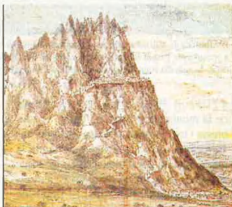
Montserrat, la muntanya sagrada, a la màgia de la qual no es pogué sostrair el pintor flamenc. Hom hi veu el monestir al replà, Colbató i el Llobregat. RAFA GIL