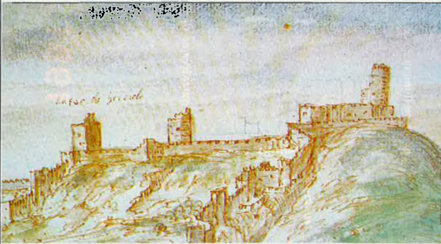
Sagunt. Sector oriental del Castell de Morvedre, amb la Torre d'Hèrcules, la del Penó i la Barrania que el coronaven. Una fita estratègica del camí litoral.