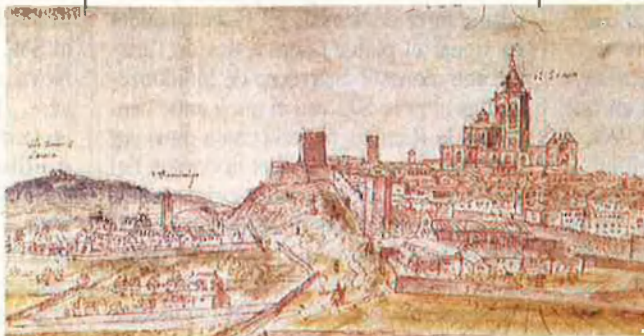
Tarragona, imatge conservada a Oxford. La històrica ciutat vista des de terra endins, abasta del santuari de Loreto fins a la casa del Bisbe. La catedral presideix el conjunt.

"com el millor topògraf del seu temps", l'especialitat que millor li escau és la de "pintor de ciutats" o stadsschilder , com deien els seus coterranis. Si tenim en compte que la majoria de tòpics del viatger d'ara compareixen a l'obra dibuixada per Van den Wijngaerde, podríem evocar un turista avant la lettre . Tanmateix, hi mancarien matisos: el seu interès per l'arqueologia, per determinats components sociològics, etnogràfics i estratègics –a part dels valors arquitectònics– no pertanyen, ni de molt, a un viatger vulgar.