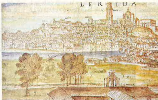
Lleida, castellanitzada, sí, però ben vista. Ciutat fluvial, amb el convent de la Mercè i el raval de Cap-pont. La Seu Vella li presideix la Suda. RAFA GIL