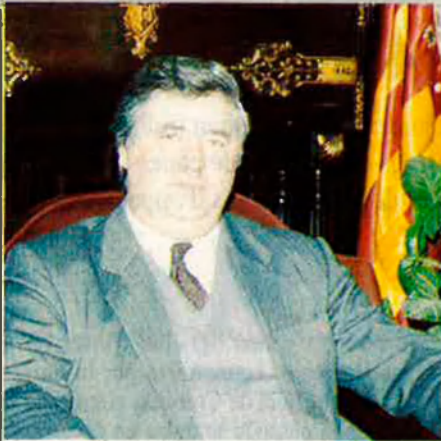
Manuel Rodríguez Macía, alcalde d'Elx.