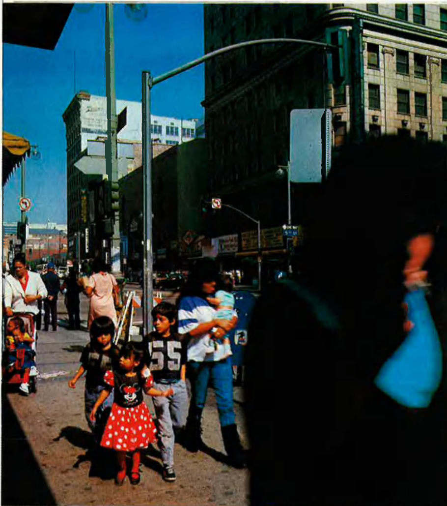
"¿Qui no té tres dòlars a Nova York?"