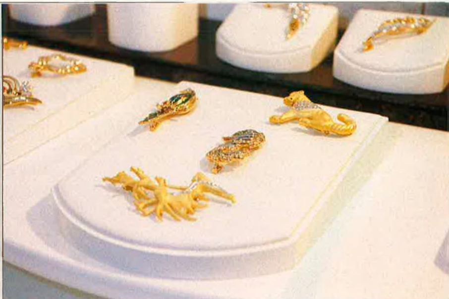
"Hi ha optimisme sobre una recuperació imminent del sector".

Ja hem parlat de la influència del disseny en el sector industrial joier i de la bijuteria. D'aquesta manera, segons les darreres exposicions—com per exemple la que va tenir lloc en l'última edició de la fira internacional de València amb el títol "Al vostre gust", i que va convocar dotze dissenyadors valencians—les formes rodones i l'esfera com a la màxima