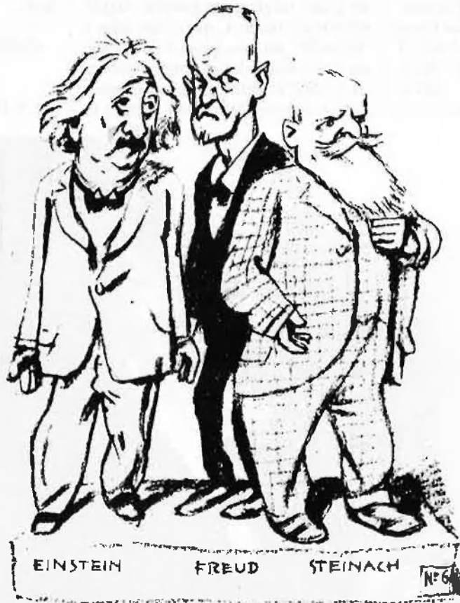
Després de seixanta anys de desterrament, Freud ha estat recuperat a Rússia.