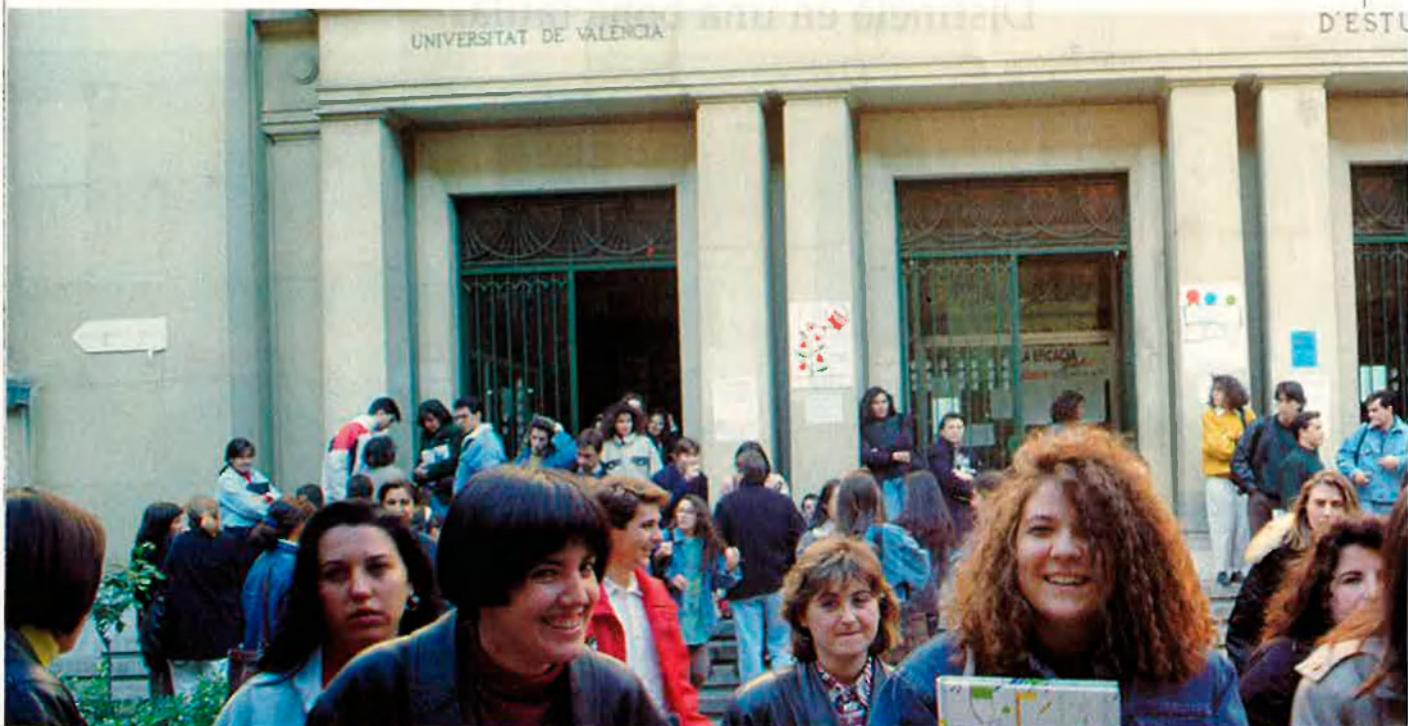
Les línies en valencià augmenten tots els anys.

Enguany se celebra el vuitè aniversari de la Llei d'Ús i Ensenyament del Valencià, un aniversari que ens dóna una perspectiva del que ha estat, és i serà el català a les aules valencianes. La felicitació s'enceta amb un retall pressupostari al foment de la llengua.