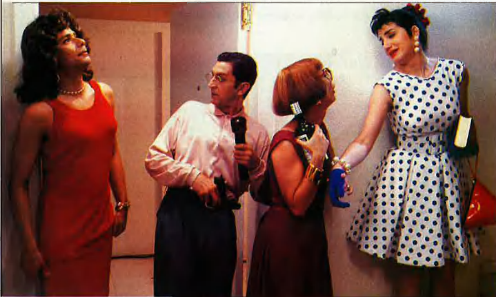
Aquesta nit o mai, de Ventura Pons