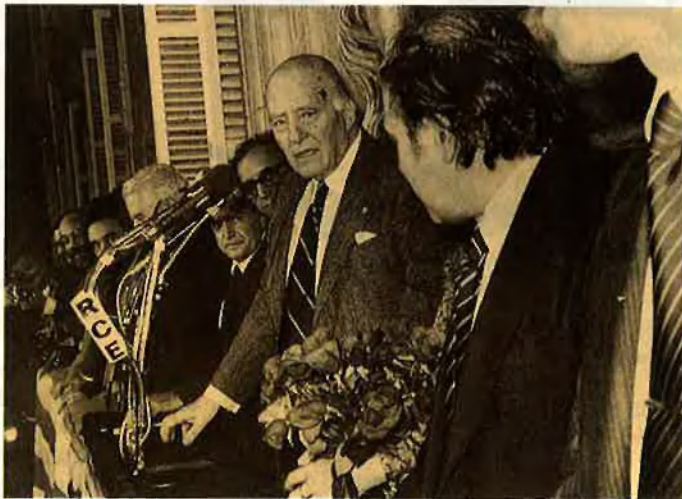
Tarradellas arriba, els Països Catalans se'n van.