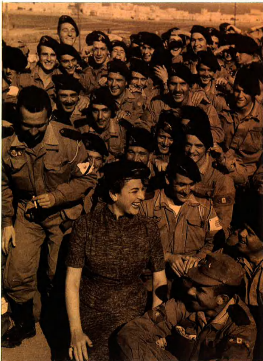
Carmen Sevilla també intentà alegrar la jornada de combat dels soldats.