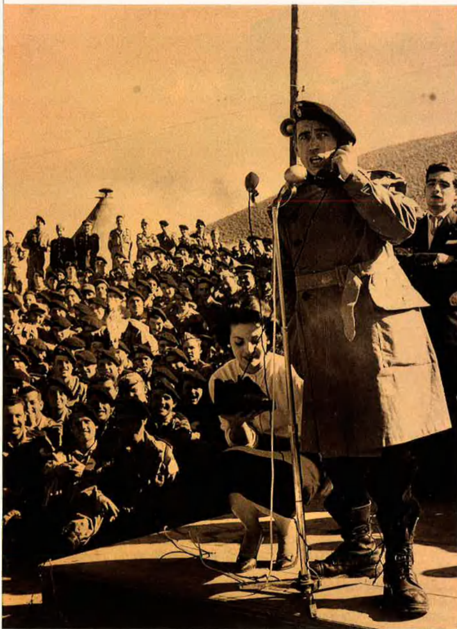
Gila va visitar els soldats pel nadal de 1957.