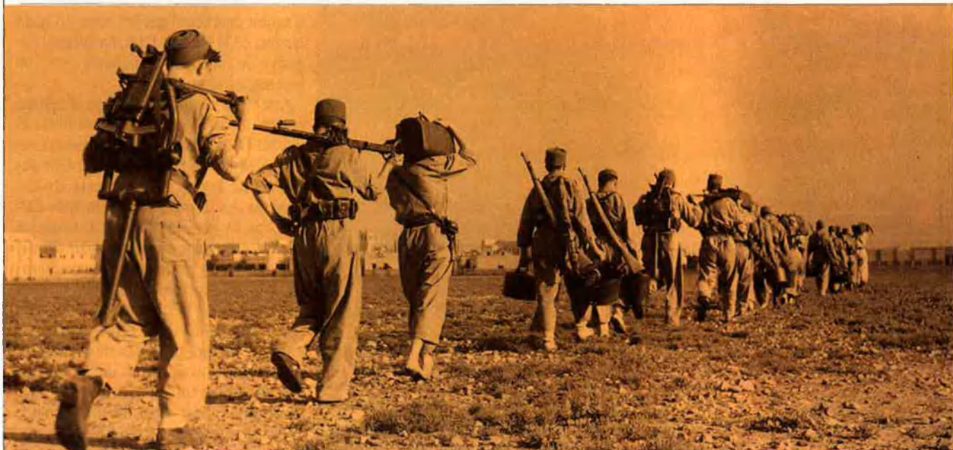
L'exèrcit utilitzava armes de la Guerra Civil.