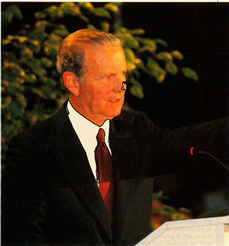
Baker, l'home imprescindible per al nou ordre.

La parella va perdre, però Bush quedà impressionat per la capacitat de mobilització de Baker, que el féu aconseguir el 60 per cent dels vots de Houston. En 1980, quan Bush decideix enfrontar-se a Reagan per la nominació dins el partit republicà, torna a cridar Baker. Quan estava clar que Reagan guanyaria, Bush decideix abandonar, a canvi de la vicepresidència. Reagan valora molt ràpidament la capacitat de treball de Baker i, d'acord amb Bush, el nomena cap de l'estat major de la Casa Blanca. I ho fa malgrat l'oposició del seu club de californians i de l'ala dura del partit, que no veu amb bons ulls Baker perquè el considera massa liberal. Però Jim es fa imprescindible. Treballa catorze hores diàries i acaba dominant tot el complex entramat que gira al voltant de la mansió del 1.600 de l'avinguda de Pensilvània de Washington. Particularment aconsegueix encantar Nancy Reagan, un veritable poder fàctic, que queda impressionada per la bona educació i la classe d'aquest texà gairebé desconegut que en pocs anys ha estat catapultat al capda-