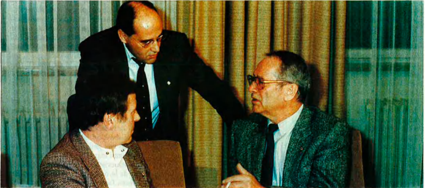
L. Bisky, G. Gysi i M. Wolf.