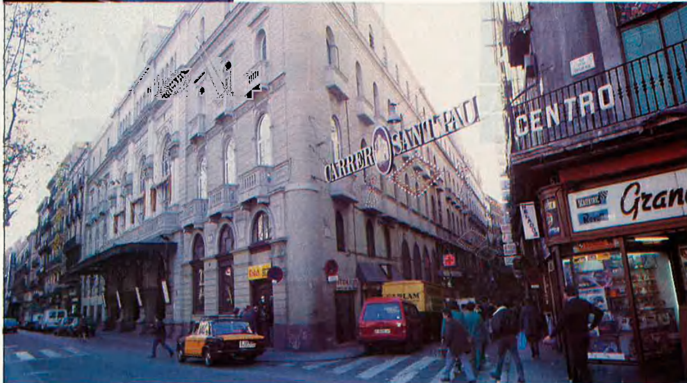
El Liceu necessita urgentment la renovació però encara no hi ha un projecte acceptat.