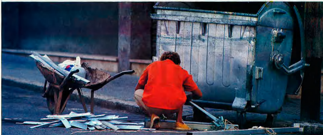
Grècia o Irlanda igualen a Catalunya en pobresa. JOAN CELIA