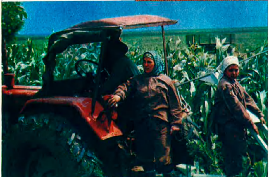
El paper de Rússia ha estat decisiu per la desintegració de l'URSS.

Quan fracassà el colp d'estat d'agost els manifestants de Moscou es van llançar al carrer portant les històriques banderes tricolors russes. Al seu costat hi havia banderes d'Ucraïna i Lituània, de Geòrgia, Bielorússia. Dos primers de maig abans, la capital de Rússia i dels soviets havia vist la primera xiulada pública al politburó que presidia els actes des de dalt del