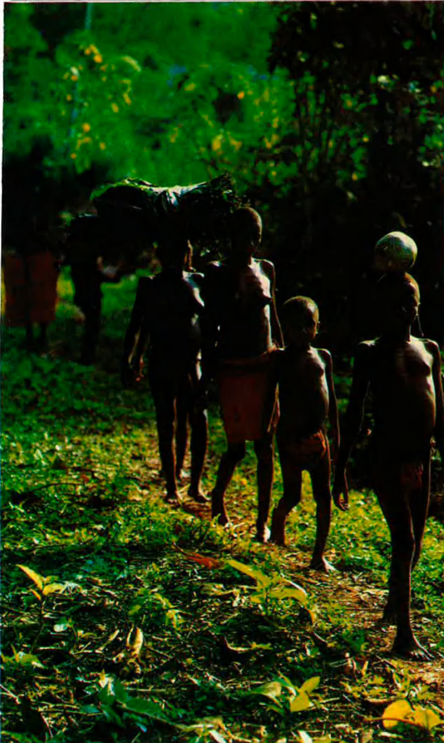
Lasituació del país ha obligat Mobutu a acceptar l'oposició.