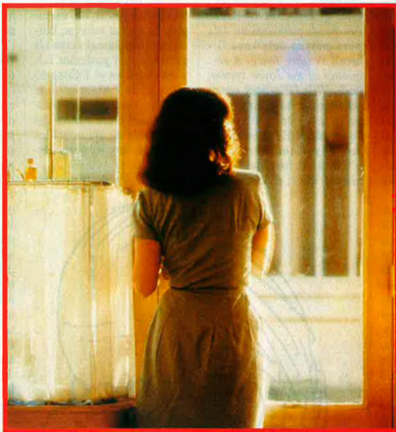
Ha estat un any... Encara no m'ho crec".