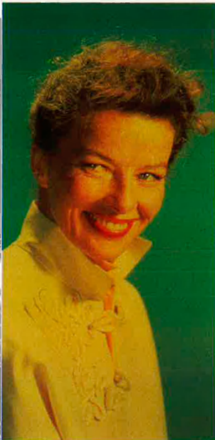
"No m'agrada recordar".

—No l'he trobada mai, ni ella m'ha trobat mai a mi.