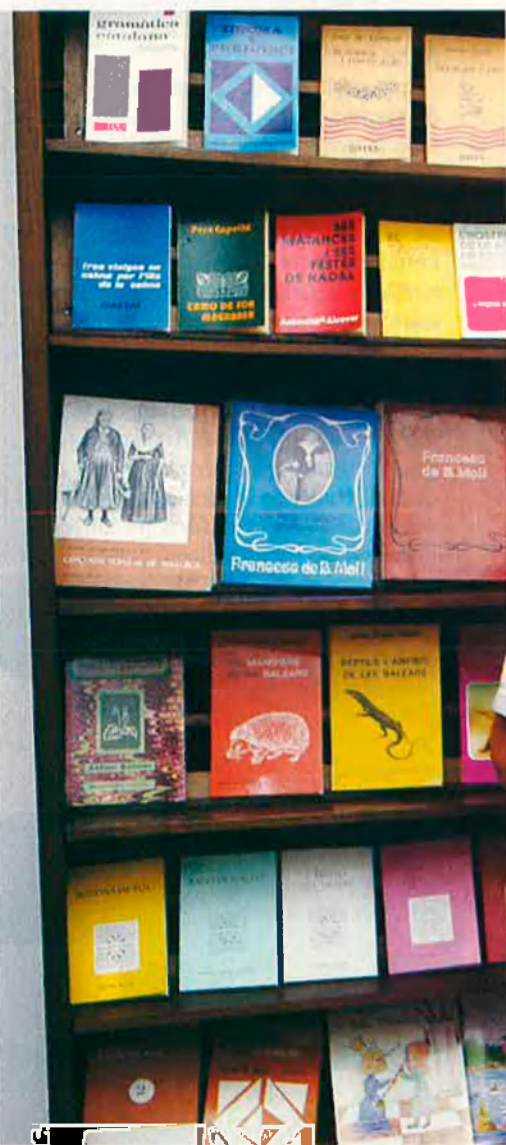
Un final feliç per a l'Editorial Moll.

D'entrada, publicar llibres en català ja és prou difícil. Més ho és encara publi-