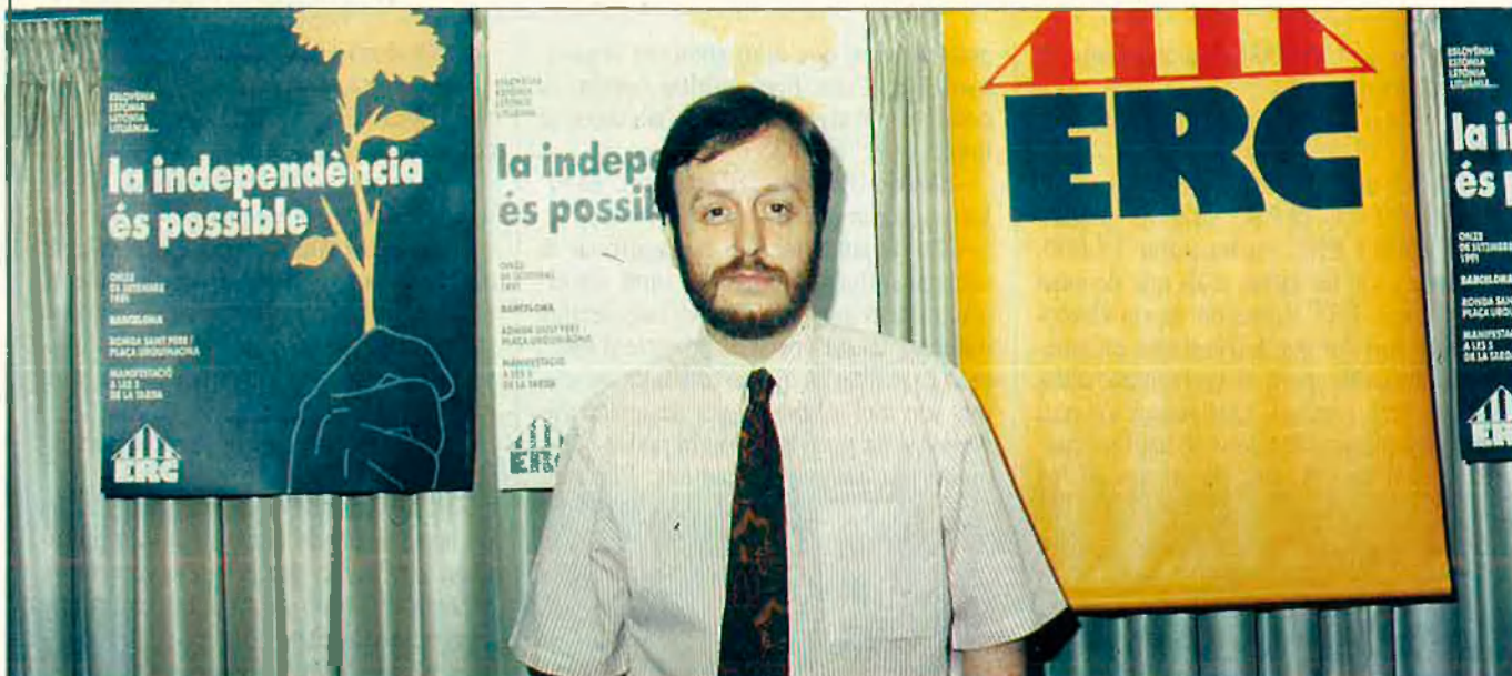
"En el nostre projecte social no es primaran ni els yuppismes ni els vedettismes".