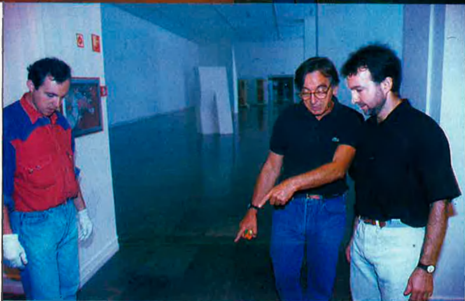
L'escultor Andreu Alfaro durant el muntatge de l'exposició que s'inaugura aquesta setmana.

Quant a la circumstància apuntada per Tomàs Llorens, que de cara al gran públic la imatge cívica de l'escultor pesa més que la de l'obra, Alfaro no vacil·la. "Si he tingut –i tinc– una actitud cívica