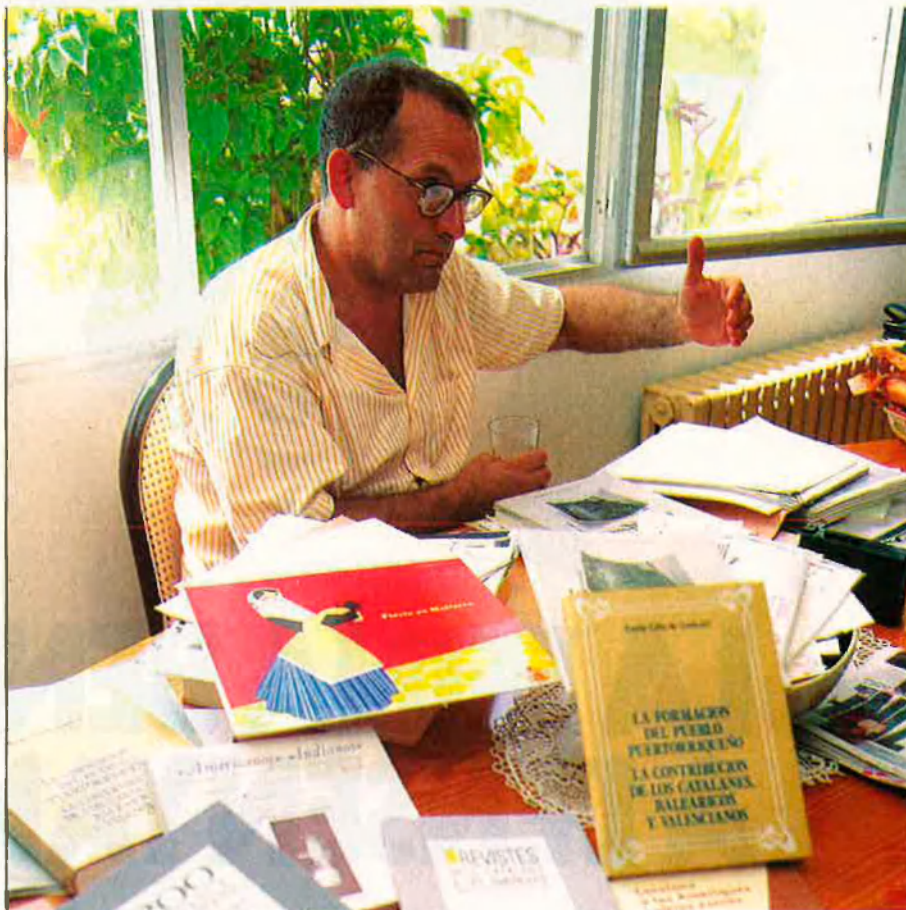
Puerto Rico i Cuba van ser dos llocs escollits pels illencs.

Posteriorment, continua explicant Serra, és quan es dona la Guerra Civil i el tipus de migració canvia. A partir del 39 el que