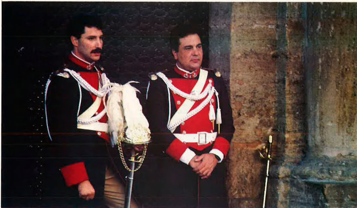
En ocasions la policia loca es un element decoratiu.