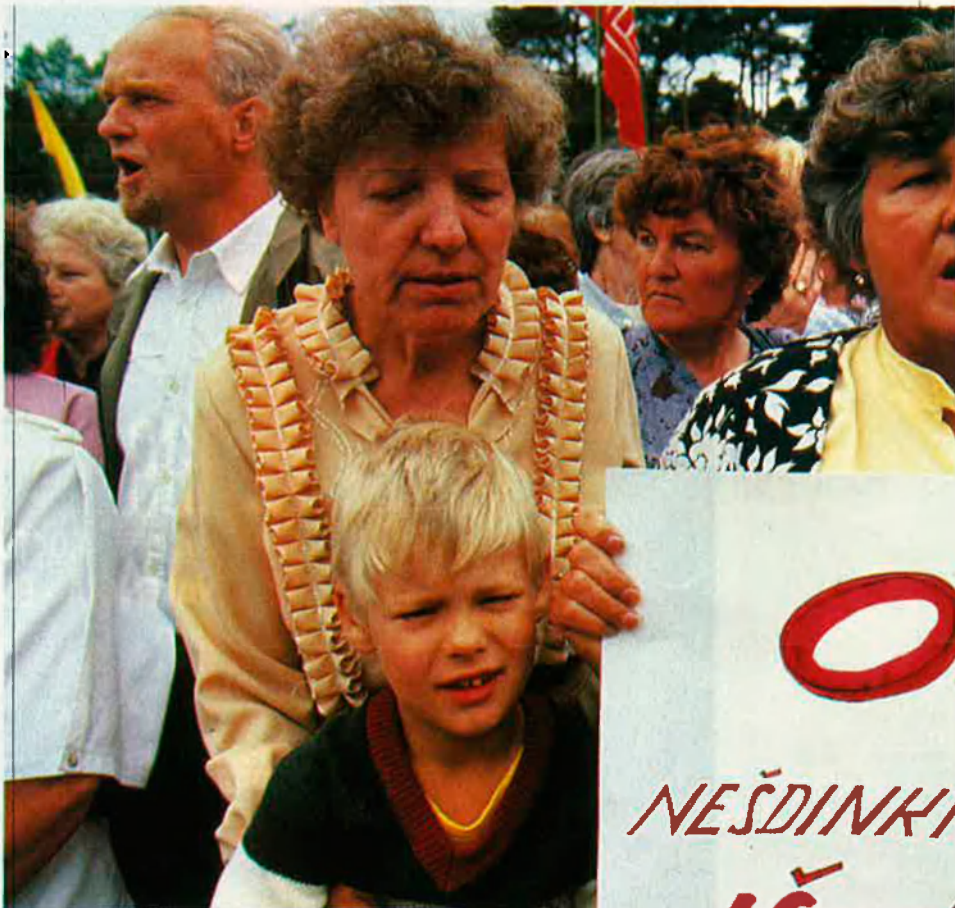
Passats els moments d'eufòria, Lituània viu amb molta normalitat la seva independència.

Anant cap al centre hem parlat del recent colp d'estat. A Vílnius no es va moure ningú, excepte els treballadors d'una fàbrica i el seu director, russos fins al moll dels ossos. Van fer retrasmetre un míting de suport als colpistes des de la mateixa fàbrica per la televisió. Però, com que els colpistes van centralitzar totes les emissions, es quedaren amb les ganes.