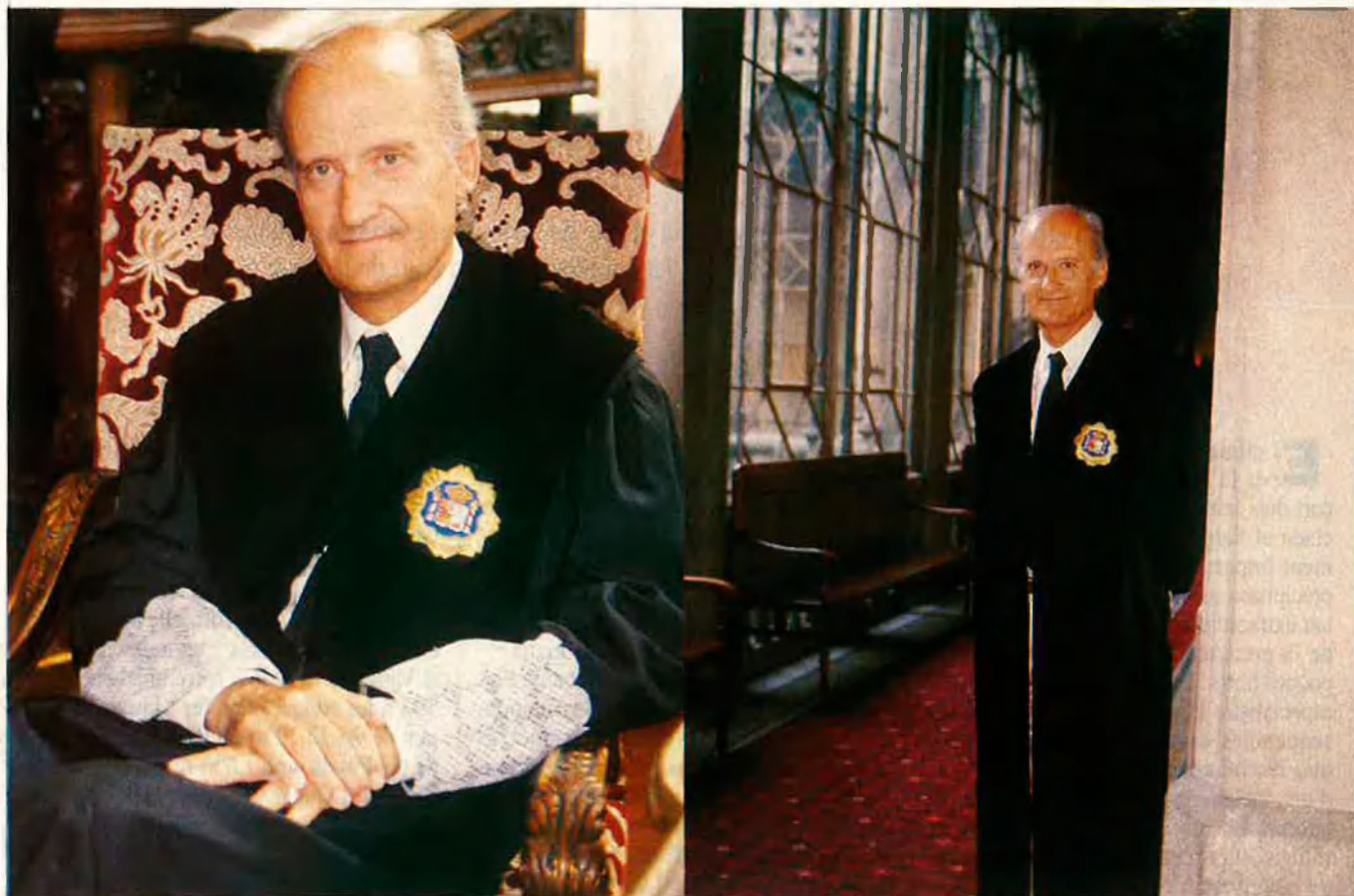
“Si un funcionari pensa viure a Catalunya ha de conèixer la llengua”.