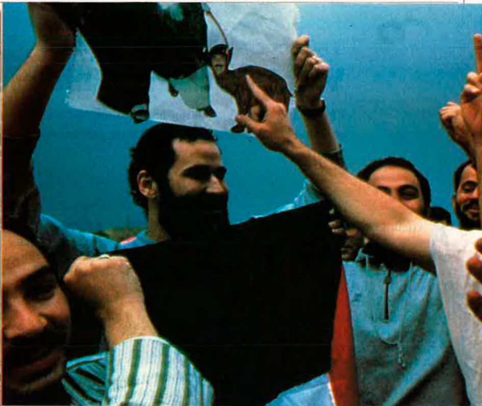
Alliberament de Kuwait.

Per celebrar la sortida del seu llibre, un repàs de les millors imatges d'aquest gegant de la fo-