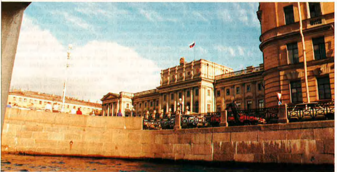
La bandera russa ja voleïa a l'ajuntament.

A la nit, poc abans de l'informatiu oficial Vrémia , el batlle de Leningrad, Anatoli Sobxac, una personalitat política a l'URSS, va aparèixer a les pantalles i amb llàgrimes als ulls va acusar els sediciosos de criminals assassins. Després del primer dia del colp encara no hi havia res de decidit. Tot depenia de la capacitat dels poders legals per mobilitzar