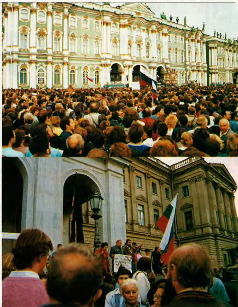
A l'esquerra decret de Boris Eltsin declarant il·legal el colp. A la dreta dalt, manifestació davant el Palau d'Hivern contra el colp d'estat; baix, els manifestants enarboren la bandera russa davant l'ajuntament.