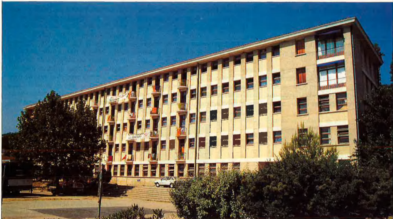
"No tenim un país normal ni aquesta és una Universitat normal".