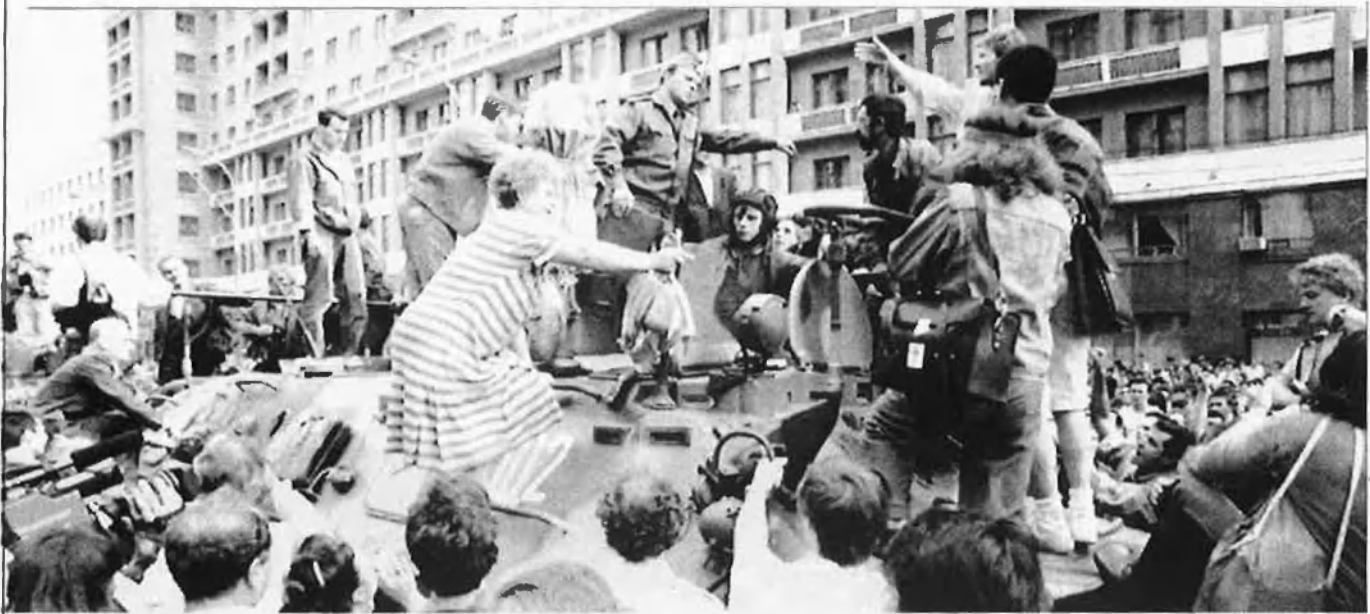
La resistència popular al colp s'ha mostrat amb enfrontaments directes amb l'exèrcit.