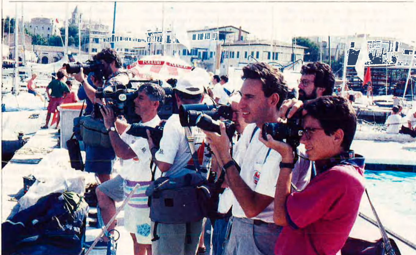
Mallorca, va començar a convertir-se en lloc d'estiueig de paparazzi quan van aparèixer noms molt coneguts.