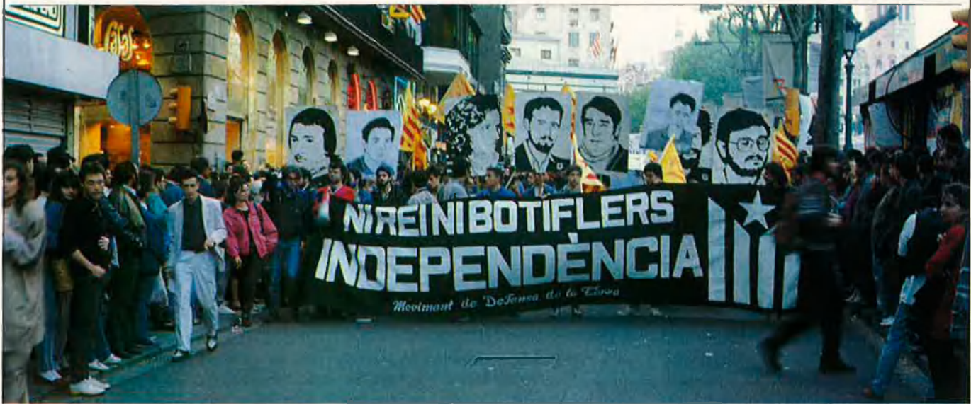
Malgrat que les condicions de vida a les presons s'endureixen, les manifestacions de suport al presos de Terra Lliure han minvat molt.