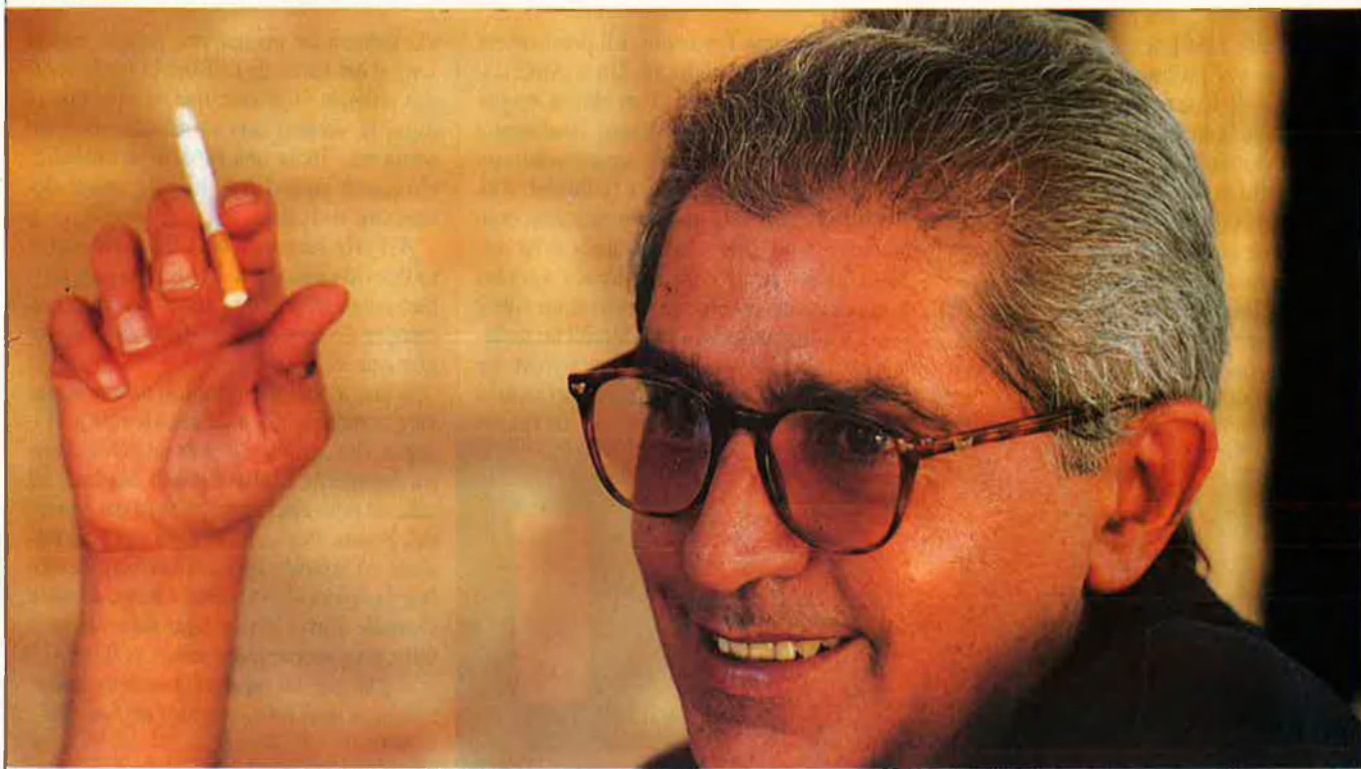
"Jo crec que la cultura no te per què ser necessàriament minoritària".