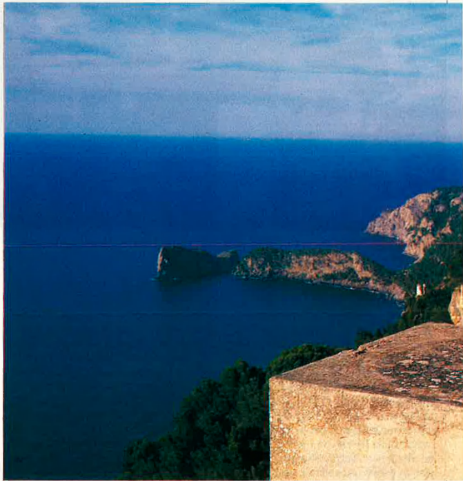
"Visc com un estranger a tots els llocs".

—Sí, jo vaig nèixer a Madrid a ca la meva padrina l'any 44. Vaig estudiar en diversos llocs. La veritat és que vaig ser una mica desastrós. Vaig passar pel col·le-