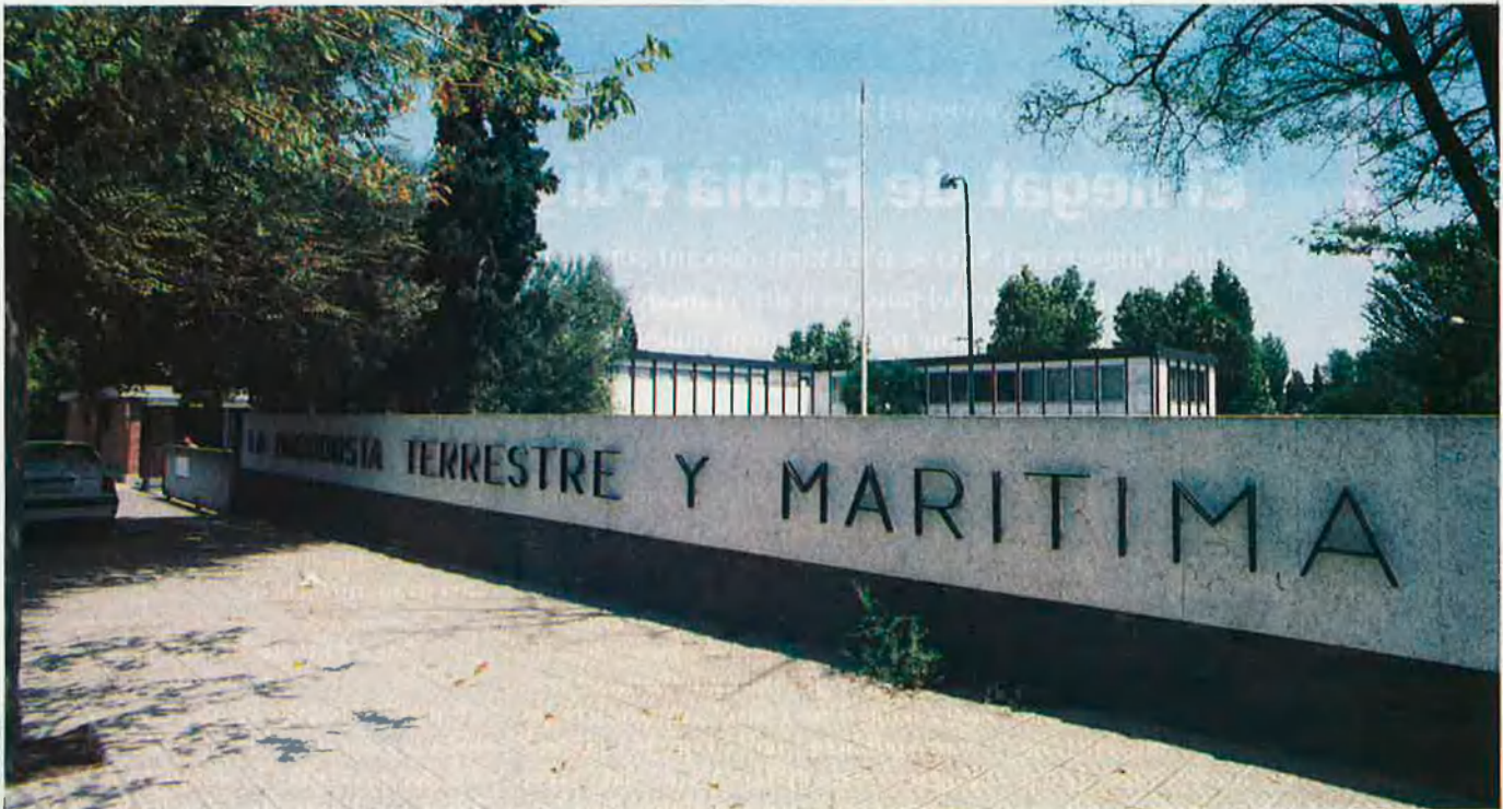
La Maquinista, un símbol de la indústria catalana que plega.