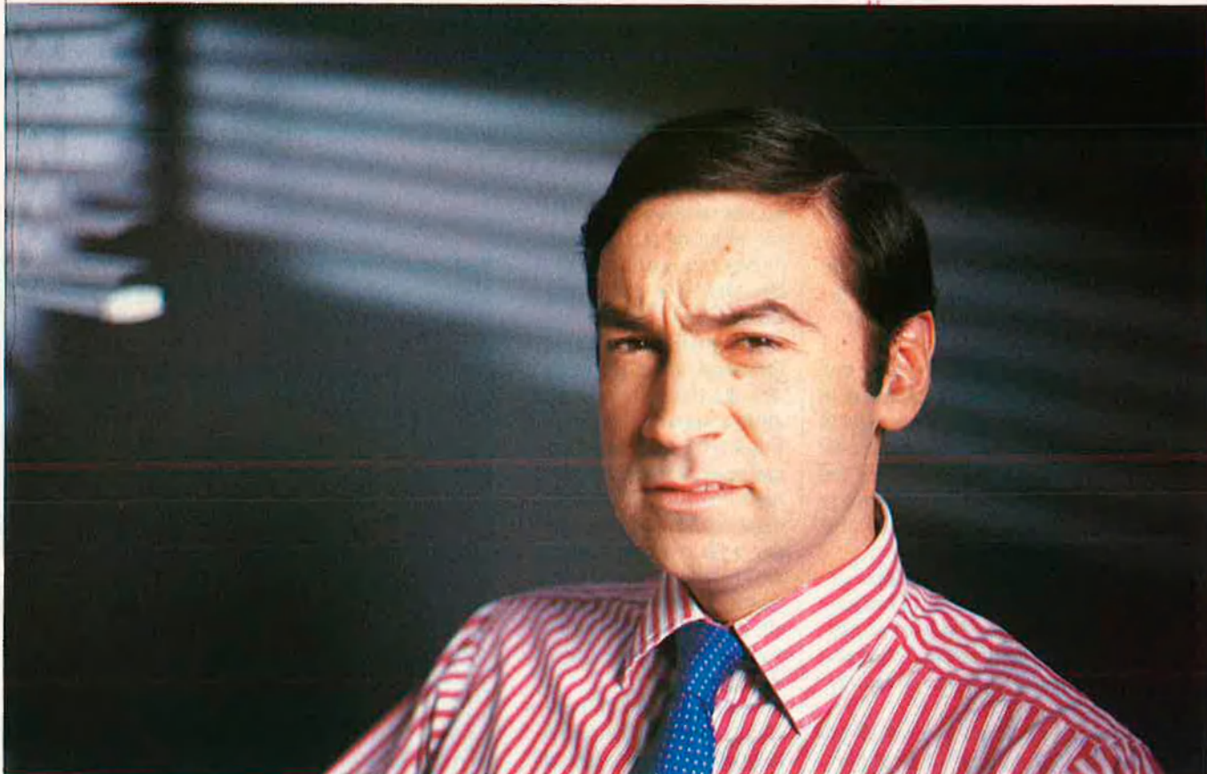
"Anem cap a una redefinició dels conceptes de sobirania".