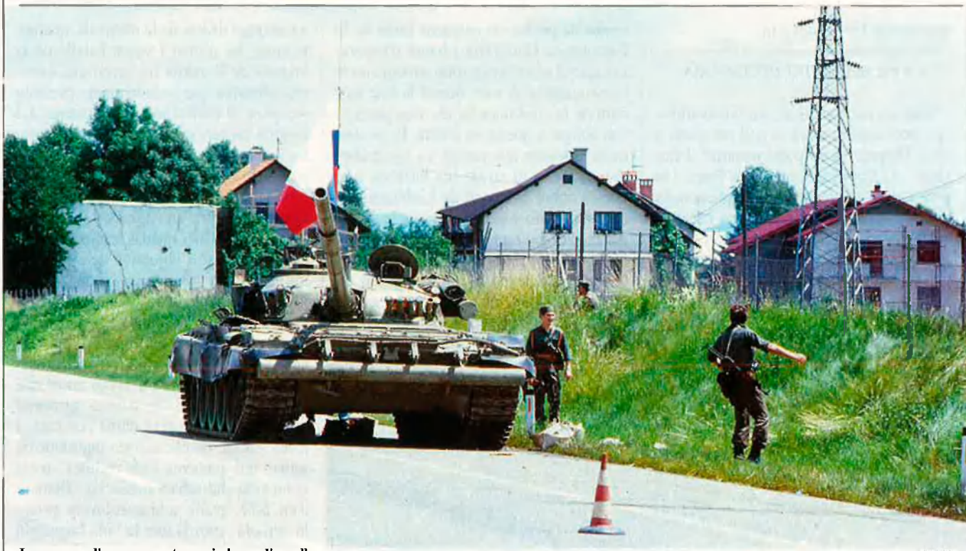
La penyora d'un cos armat que viu hores d'orgull.