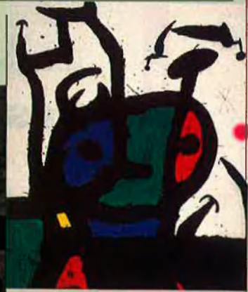
Pintura de Joan Miró.