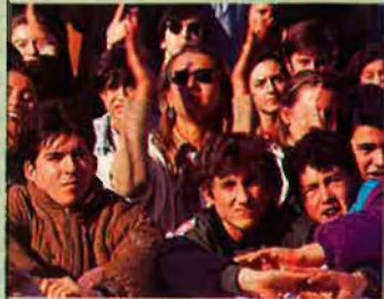
Cada cop hi ha més orquestres infantils.

Una part del fons Miró que es guarda a la Fundació Pilar i Joan Miró, de Palma, i que era pràcticament desconegut ja que el pintor ho guardava a casa seva sense exhibir-ho mai, es mostrarà a partir del pròxim dia 18 a diverses localitats de Galícia. Aquest fons agrupa un total de 59 obres, valorades en uns tres mil milions de pessetes.