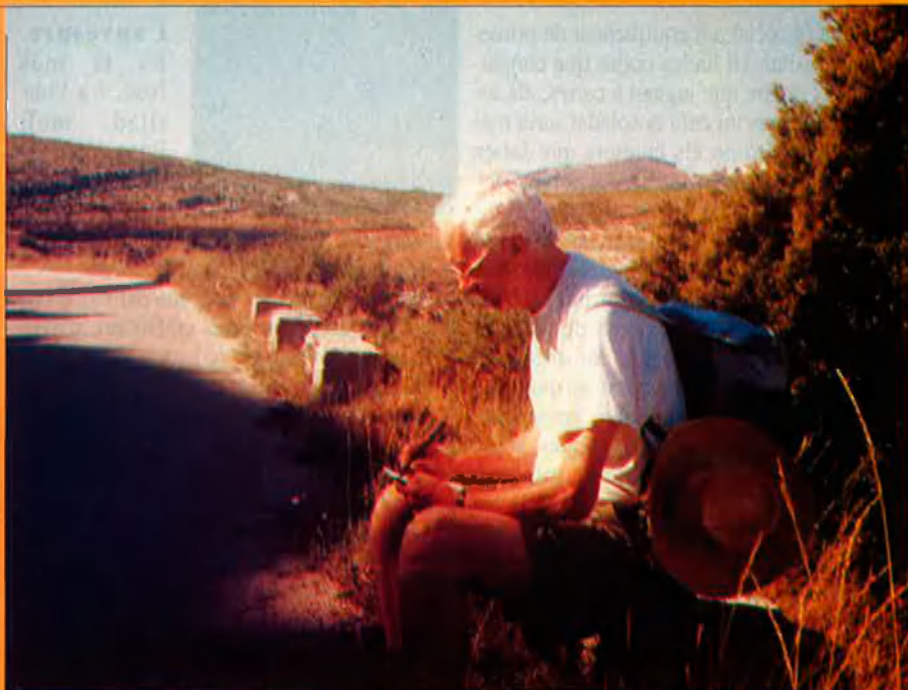
"Anar en grup no permet viure a fons l'experiència d'estranyament del món habitual que és un viatge a peu".