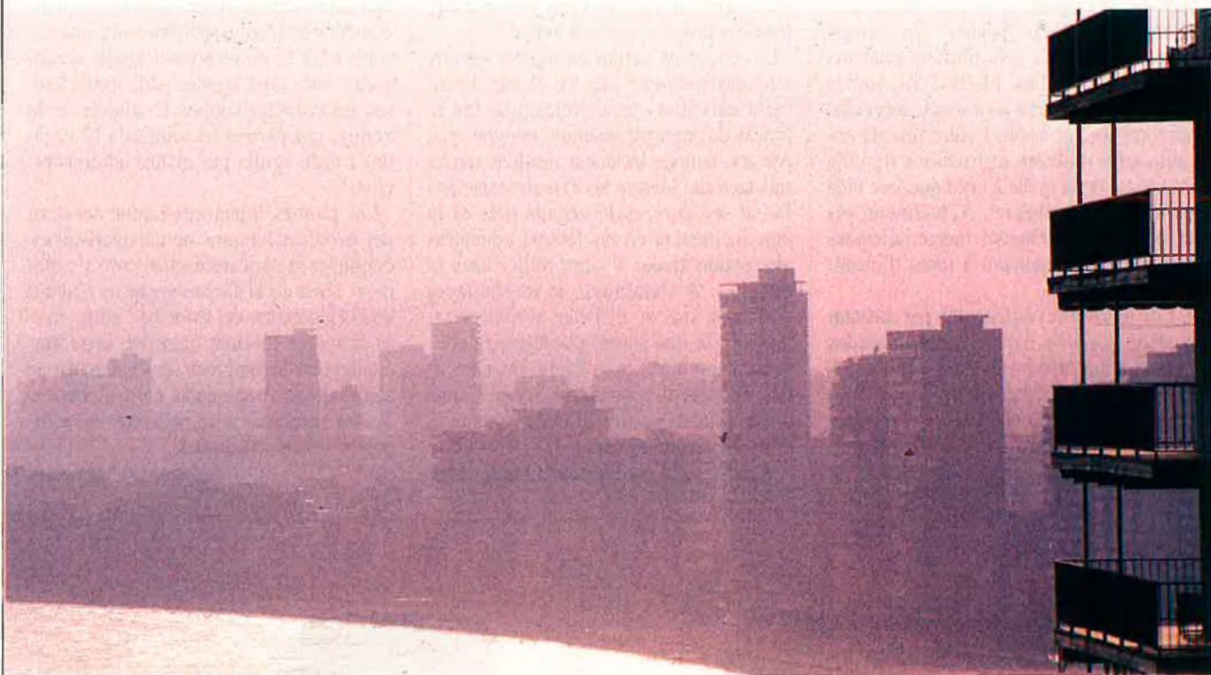
Benidorm, important centre de distribució de cocaïna.

Les últimes dades policíiques confirmen que la ciutat de Benidorm, l'aeroport de l'Altet i el moll d'Alacant s'han convertit en uns quants anys en un nus estratègic per a les rutes mundials de la droga.