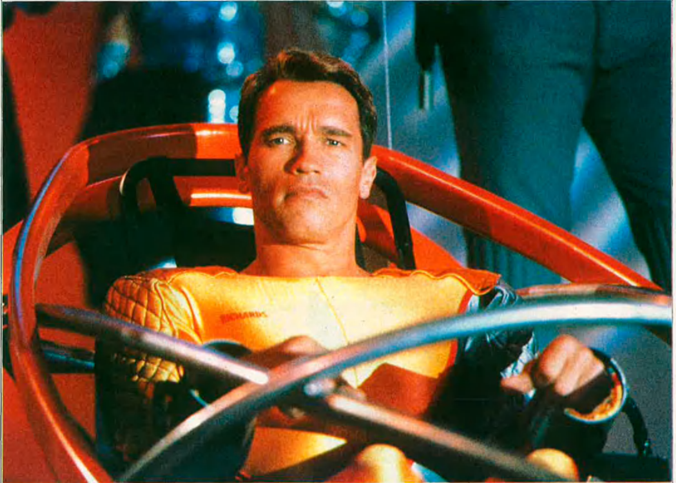
"Per a mi la igualtat comença a l'hora de fregar els plats".