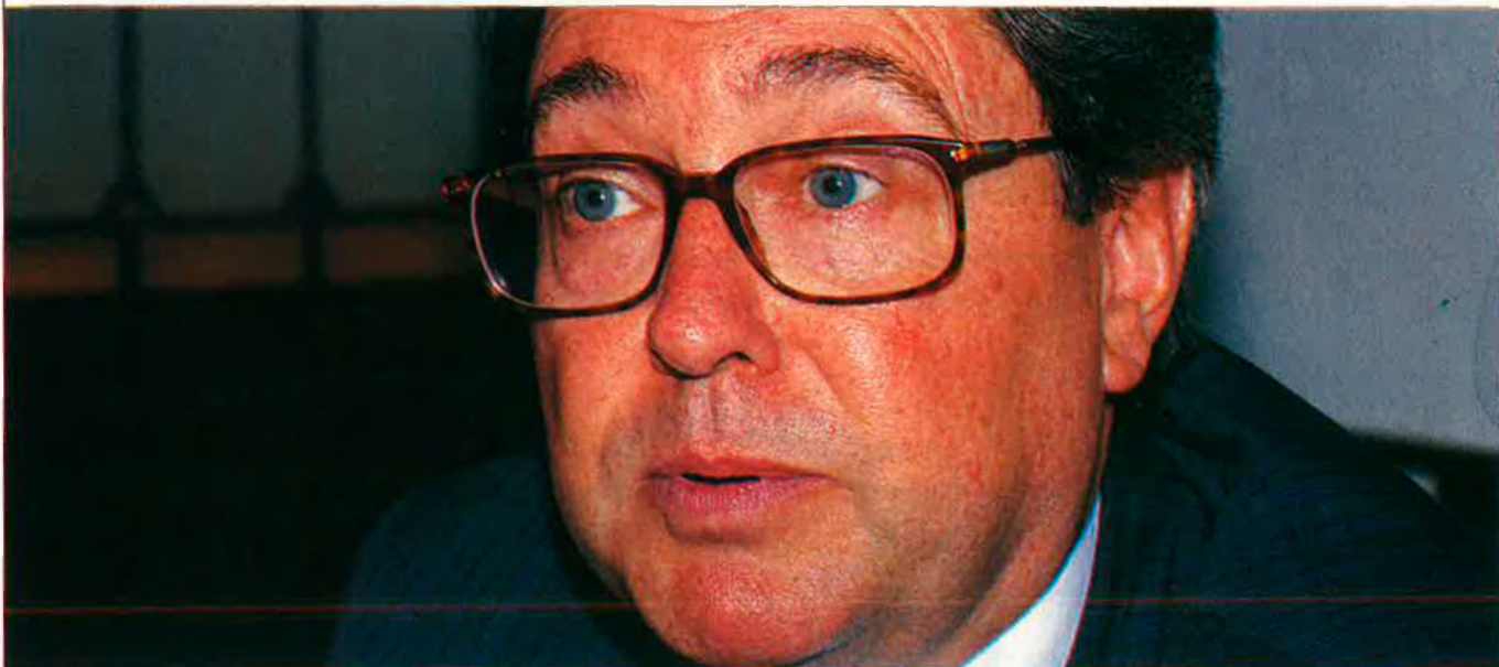
"Tot el que es faci per reforçar l'ús de la nostra llengua és importantíssim".