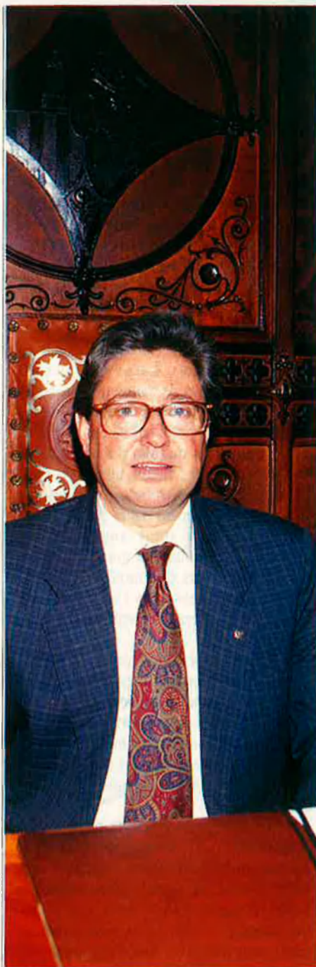
"Intentaré fer els mínims canvis possibles". J. CELIA

—Fonamentalment intentarem fer els mínims canvis possibles. Crec que l'administració no ha de sofrir el més mínim trauma. Ara bé, hi haurà serveis, com per exemple el d'urbanisme, que sí que haurà de sofrir modificacions un poc substancials, perquè en aquests moments està col·lapsat totalment. En aquest cas hauré de prendre mesures un poc més enèrgiques. En realitat, i, excepte dues empreses municipals en què hi haurà canvis de gerent, pràcticament totes les més altres